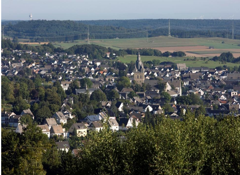
Unser schönes Brilon!